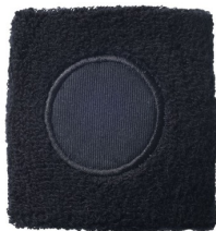
Produit : Poignet éponge avec écusson Réf : PT0210