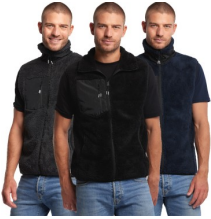
Produit : Sherpa sans manche homme Réf : WO0001